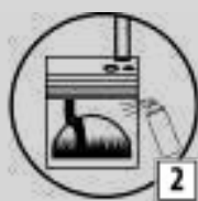
Шаг 2. Нанести спрей на отложения.