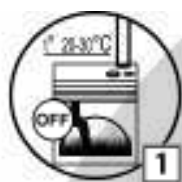
Шаг 1. Погасить горелку оборудования, дать остыть оборудованию до t° 20-30°С.