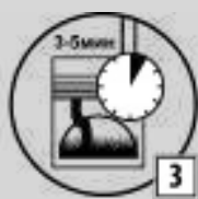
Шаг 3. Дождаться впитывания раствора в отложения (3-5 минут).